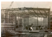
Bau der Turnhalle 1976